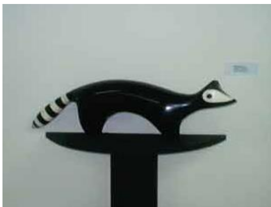
Fotografía 6 - Escultura de Ernesto Cardenal.