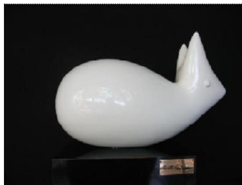
Fotografía 18 - Escultura Ernesto Cardenal.