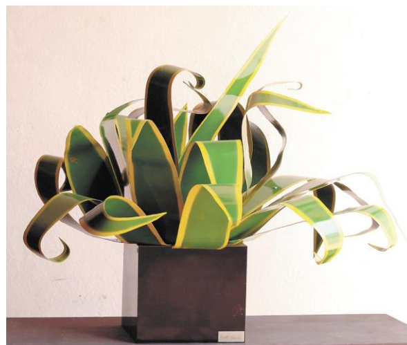
Fotografía 7 - Escultura Ernesto Cardenal.