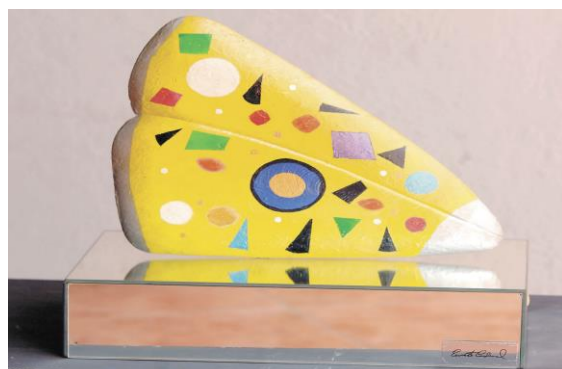
Fotografía 3 - Escultura Ernesto Cardenal.