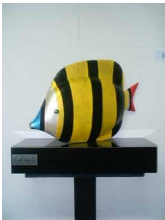
Fotografía 8 - Escultura de Ernesto Cardenal.