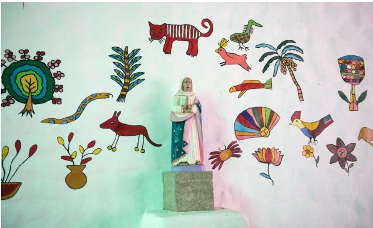
Fotografía 10 - Detalles pictóricos de la Iglesia en Solentiname.