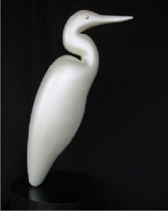
Fotografía 12 - Escultura Ernesto Cardenal.