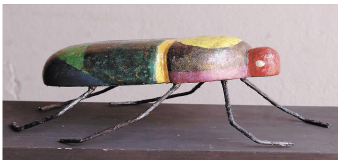
Fotografía 2 - Escultura Ernesto Cardenal.