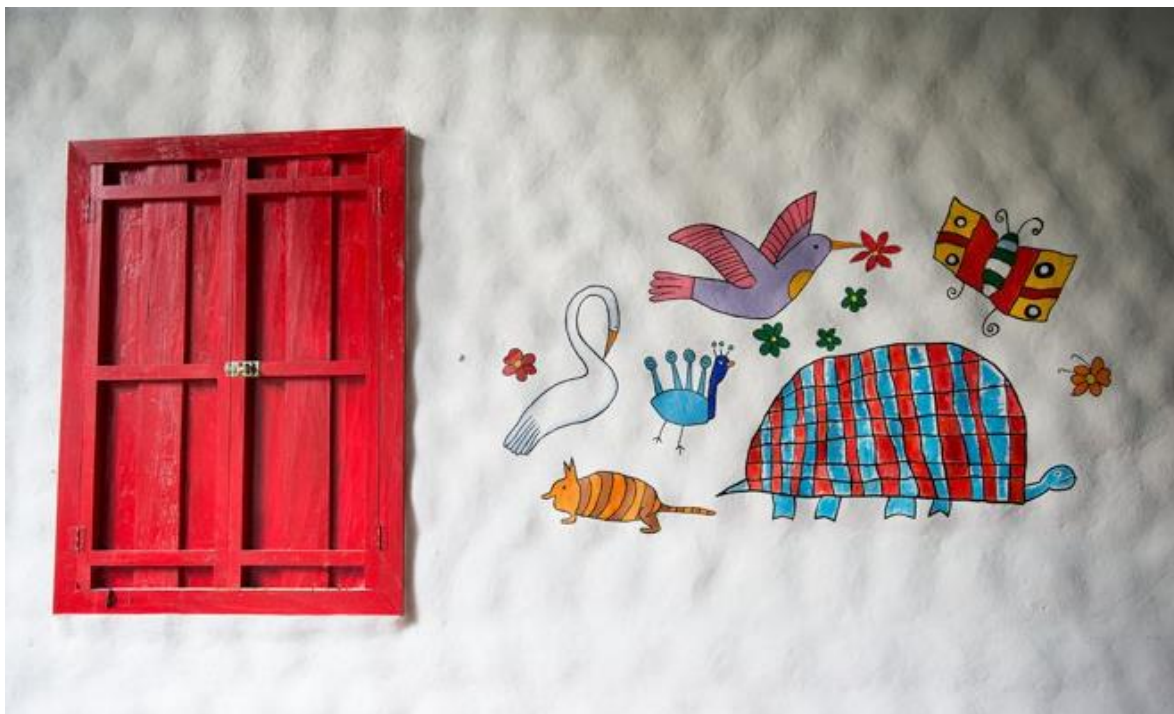
Fotografía 11 - Detalles pictóricos de la Iglesia en Solentiname.