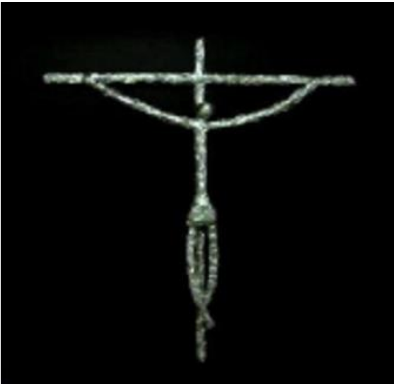
Fotografías 14, 15 y 16 - Esculturas Ernesto Cardenal.