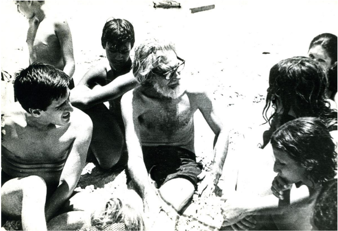
Fotografía 20 - Roque Dalton (izquierda), Ernesto Cardenal (centro). Primera visita del Sacerdote nicaragüense a Cuba.