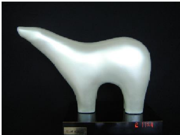
Fotografía 17 - Escultura Ernesto Cardenal.