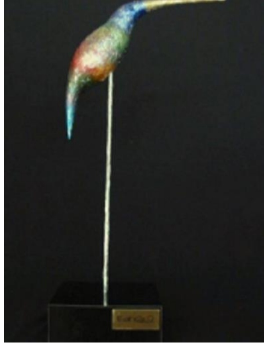
Fotografía 13 - Escultura Ernesto Cardenal.