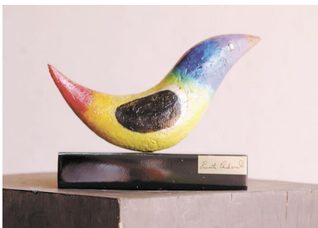
Fotografía 4 - Escultura Ernesto Cardenal.