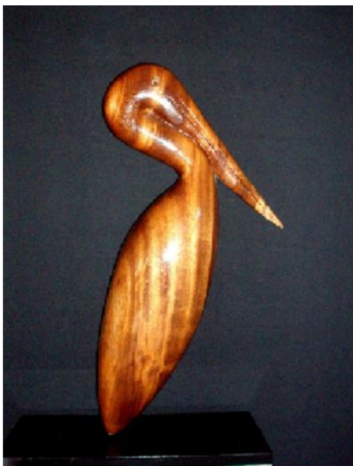
Fotografía 19 - Escultura Ernesto Cardenal.