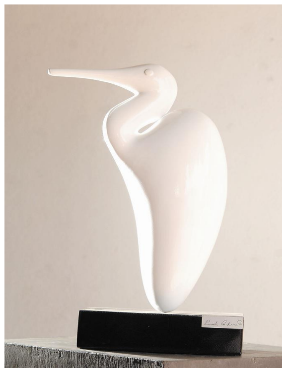
Fotografía 9 - Escultura Ernesto Cardenal.