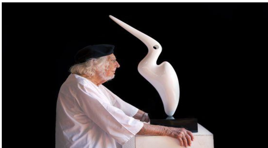
Fotografía 1 - Ernesto Cardenal posa junto a una de sus esculturas en su taller de Managua.