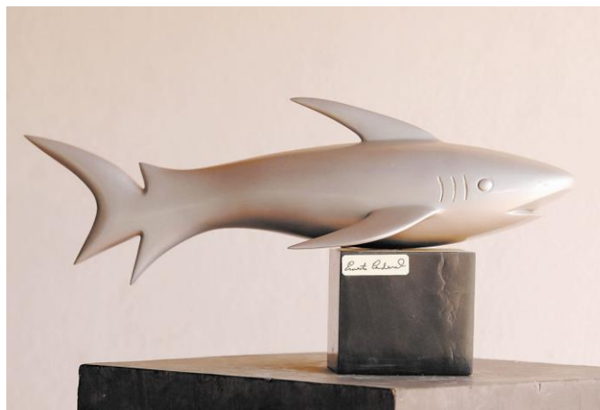
Fotografía 5 - Escultura Ernesto Cardenal.