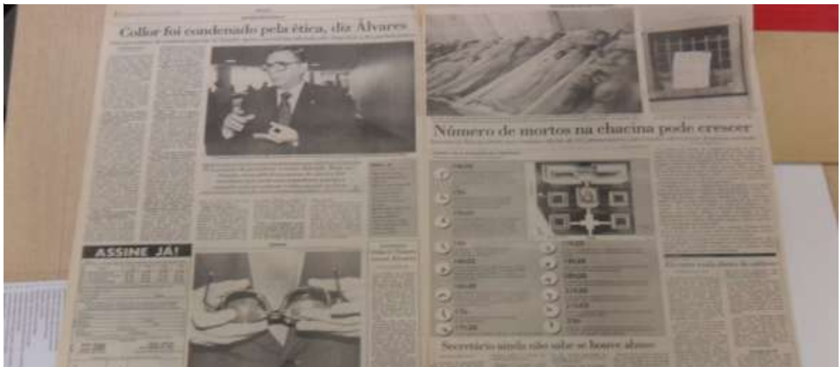
Figura 9 Edición del 6 de octubre de 1992.