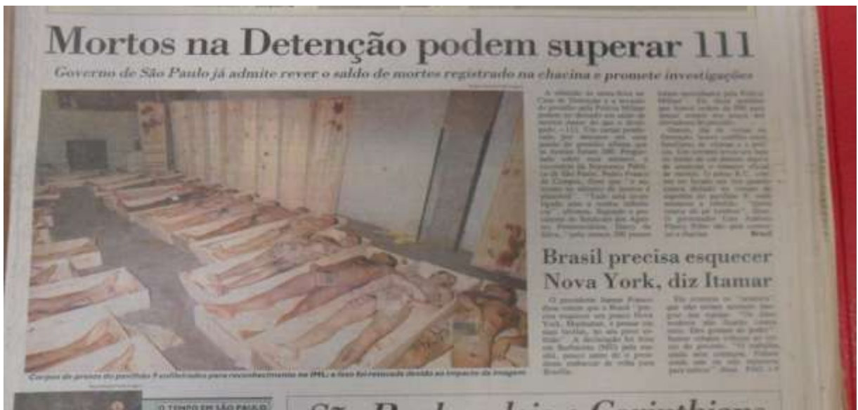
Figura 6 Edição del 5 de octubre de 1992.