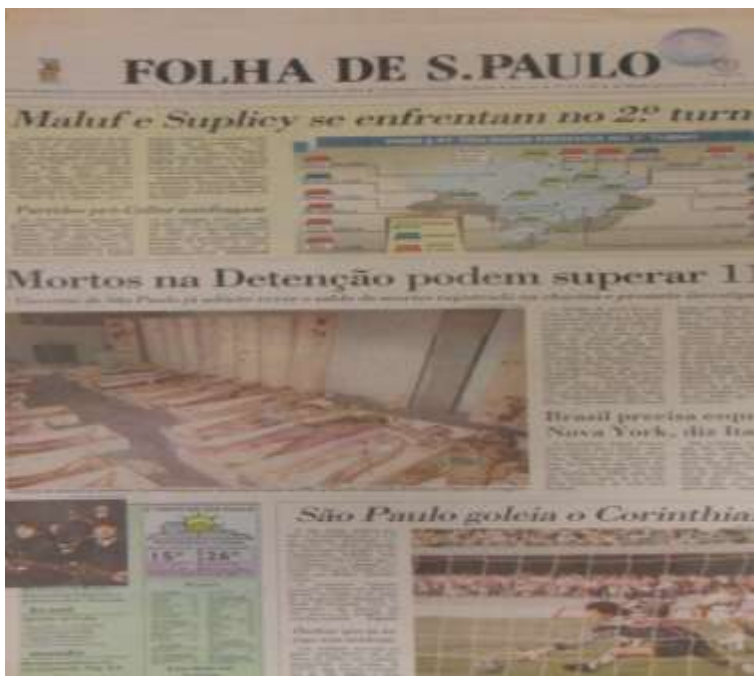
Figura7 Edição del 5 de octubre de 1992.