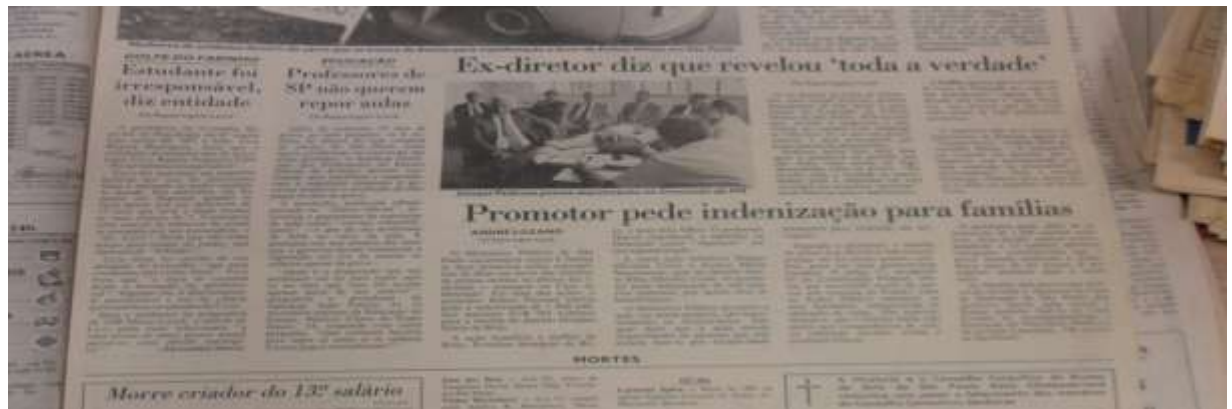
Figura 16 Edición del 14 de octubre de 1992.