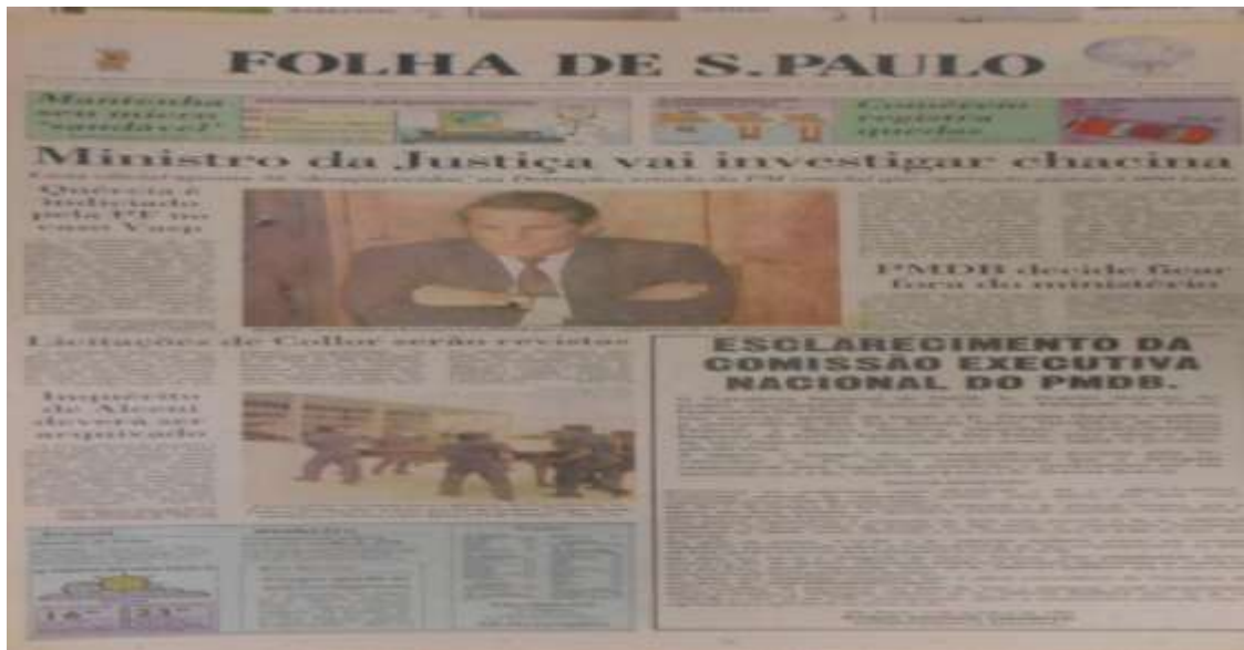
Figura 11 Edición del 8 de octubre de 1992.