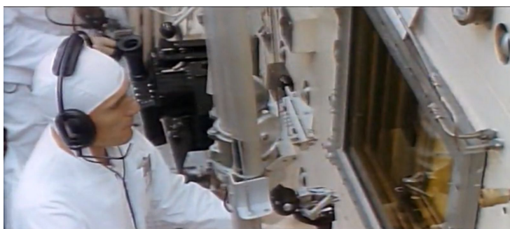
Imagem 1 - Introdução à sequência da fábrica na versão de 1971.

2