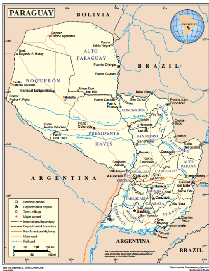
Figura 1: Mapa de Paraguay

La República del Paraguay esta ubicada en el centro de América del Sur, por eso se lo conoce como el "corazón de América"; es un país mediterráneo, no tiene salida directa al mar.