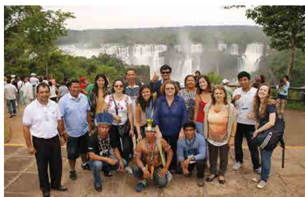
Visita às Cataratas