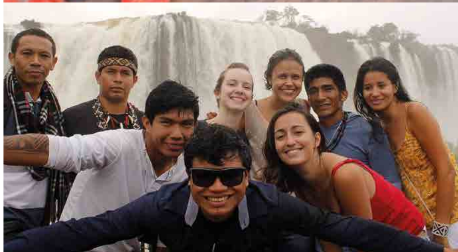
Visita às Cataratas