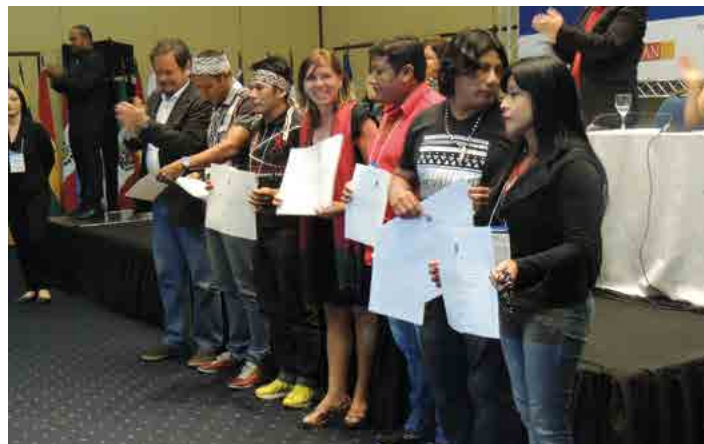
Língua Guarani Mbya