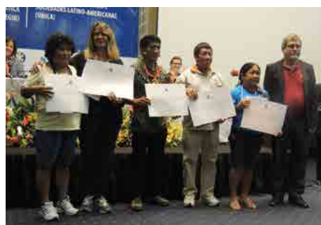
Língua Asurini do Trocará