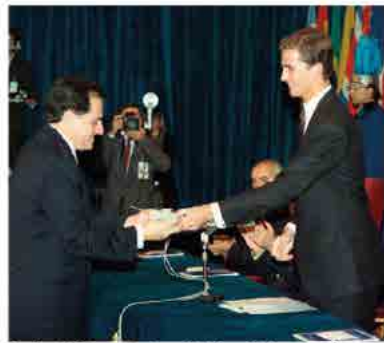
Rafael Hernández Colón, Gobernador y representante del Pueblo de Puerto Rico recoge el premio Príncipe de Asturias de las Letras

importante de puertorriqueños hacia el nordeste de los EE. UU. La influencia del inglés es evidente en la isla, pero no debemos dudar de su identidad hispana. El pueblo de Puerto Rico ha sido merecedor del Premio Príncipe de Asturias de las Letras 1991 como reconocimiento a la “decisión ejemplar” de “haber declarado al español único idioma oficial de su país”.