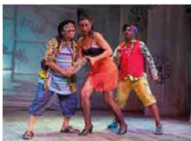
Sainete cubano, con los personales del negrito, el gallego y la mulata. 2009.

Según los datos de Boyd-Bowman (1956, 1963, 1964, 1968, 1972), no existen pruebas de que los andaluces predominaran frente a un grupo castellano o heterogéneo en el largo periodo colonial, pero, fuera por causa de la influencia andaluza o por un desarrollo paralelo, lo cierto es que las hablas meridionales y las americanas coinciden en el seseo, el uso de ustedes por vosotros , el léxico “arcaico”... La