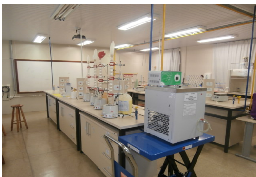
Figura 1. Aparato para a produção de HMF.

de fundo chato de 500 mL juntamente com 15 mL de HCl a 0,50 mol L -1 . O aquecimento do sistema foi realizado empregando uma manta aquecedora (EDULAB, 500 mL), e um condensador Allihn de 600 mm conectado a um sistema de aborbulhamento. A mistura foi aquecida sob refluxo a 85 °C durante 60 min. Adicionaram-se 3,0 g de NaCl e 20 mL de n-butanol, sendo a mistura mantida a 155 °C durante 90 min. A purificação do HMF no meio reacional foi realizada empregando sistema de destilação. Para isto, controlou-se o meio reacional, neutralizando a mistura com uma solução de NaHCO 3 saturada, e MgSO 4 para secagem da fase orgânica. Em seguida, a amostra foi destilada a 115 °C.