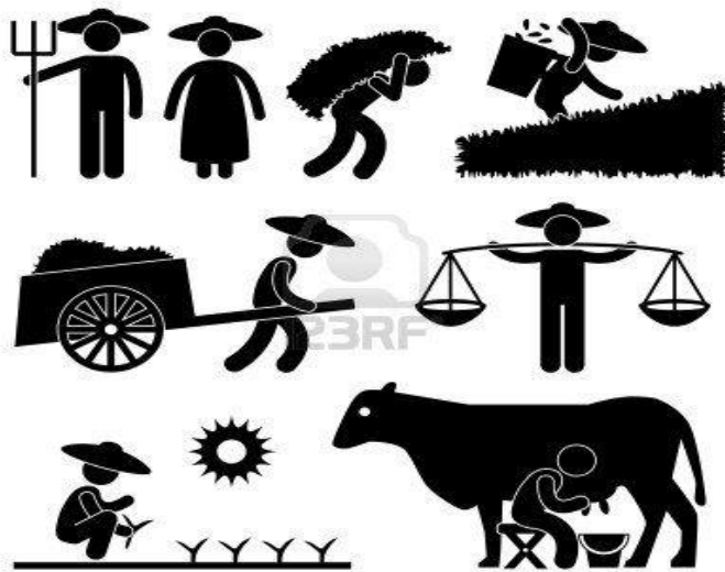
Figura 3 – Actividades Agrícolas.