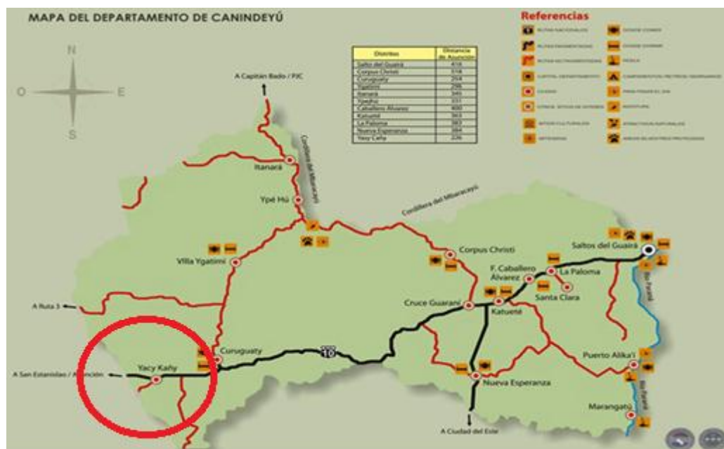
Figura 1 – Localización de Yasy Kañy.

En el siguiente mapa podemos observar donde está localizada el distrito de Yasy kañy.