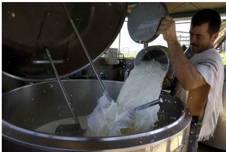
Figura 2 – Producción de leche en Canindeyú, Distrito de Yasy Kañy.