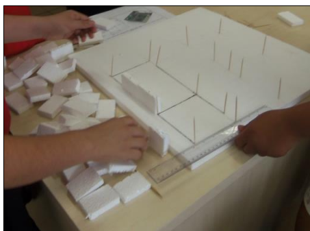
Figura 9 - Alunos demarcando as medidas encontradas

Em seguida cada grupo foi encontrando o número pelo qual deveriam dividir as medidas da planta que detinham e começaram a demarcar as medidas na base, conforme a Figura 1. As medidas que encontraram foram diferentes, até mesmo entre os grupos que possuíam a mesma planta, visto que, a proporção poderia ser escolhida por eles, mostrando a não existência de um único resultado correto, mas sim várias interpretações da mesma tarefa.